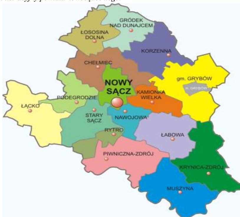
Mapa 1. Podział administracyjny powiatu nowosądeckiego.

Największą częścią powierzchni powiatu nowosądeckiego zajmują kolejno: Gmina Grybów, Gmina Krynica - Zdrój oraz Gmina Muszyna, zaś najmniejszymi jednostkami są: Miasto Grybów oraz Gmina Rytro.