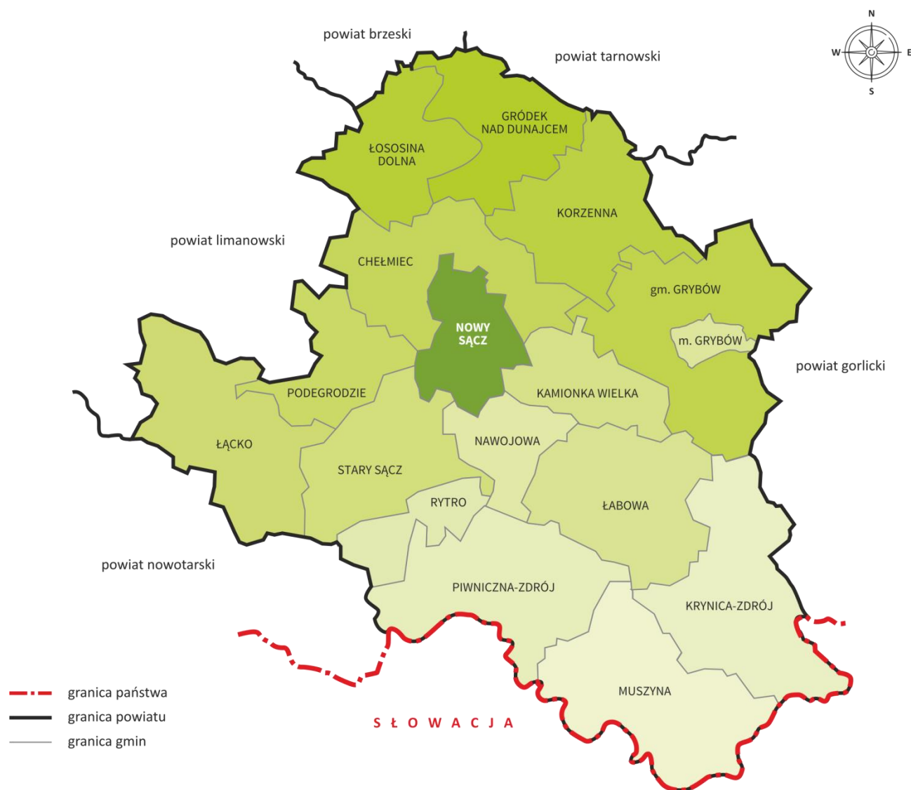
Mapa 1. Podział administracyjny powiatu nowosądeckiego.

Największą częścią powierzchni powiatu nowosądeckiego zajmują kolejno: Gmina Grybów, Gmina Krynica - Zdrój oraz Gmina Muszyna, zaś najmniejszymi jednostkami są: Miasto Grybów oraz Gmina Rytro.